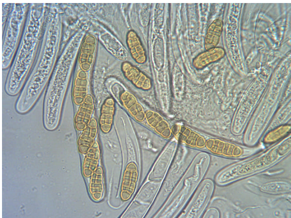
Asci Afm. 100 – 110 x 12 – 14 \mu m