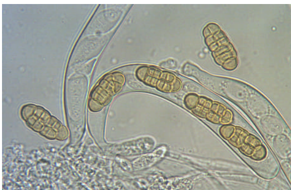
Sporen. Afm. 21 – 24 x 8 – 10 \mu m